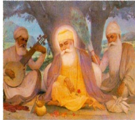
Fundador de Religión Sij – Guru Nanak Sahi Ji

Esta Palabra viene de Él, Quien ha creado el mundo. - El Gurú Nanak