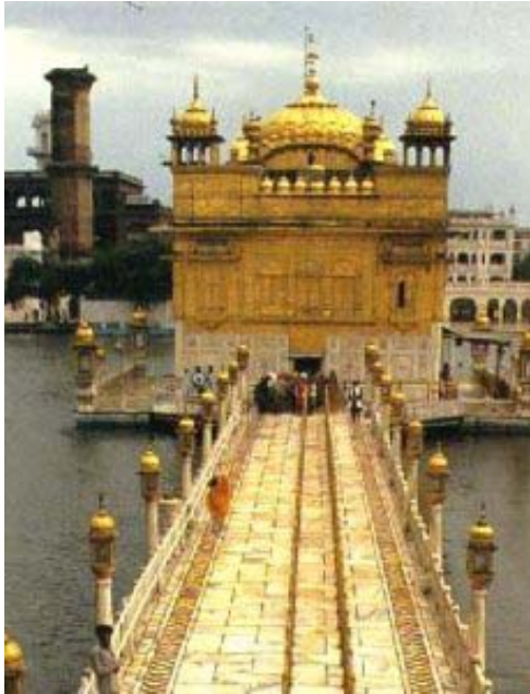
De Sri Darbar Sahib

Kort voordat Gobind Singh overleed, gaf hij aan dat de Sri Guru Granth Sahib het spirituele gezag zou zijn voor de Sikhs. Sri Guru Granth Sahib bevat niet alleen lofzang van de tien Sikh leermeesters, maar ook van negenentwintig andere Hindoes, Sikhs en Moslim geleerden. De belangrijkste tempel (Gurudwara) is gebouwd door Guru Arjan Sahib.