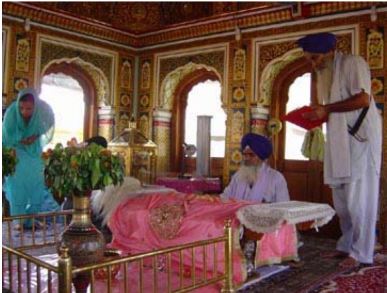
Sri Harmandir Sahib in Amritsar, India