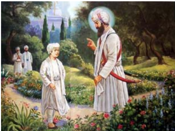
Een Guru onderwijst een jonge Sikh.

De positie van de mens ten opzichte van de natuur is volgens het Sikhisme dus gelijkwaardig.