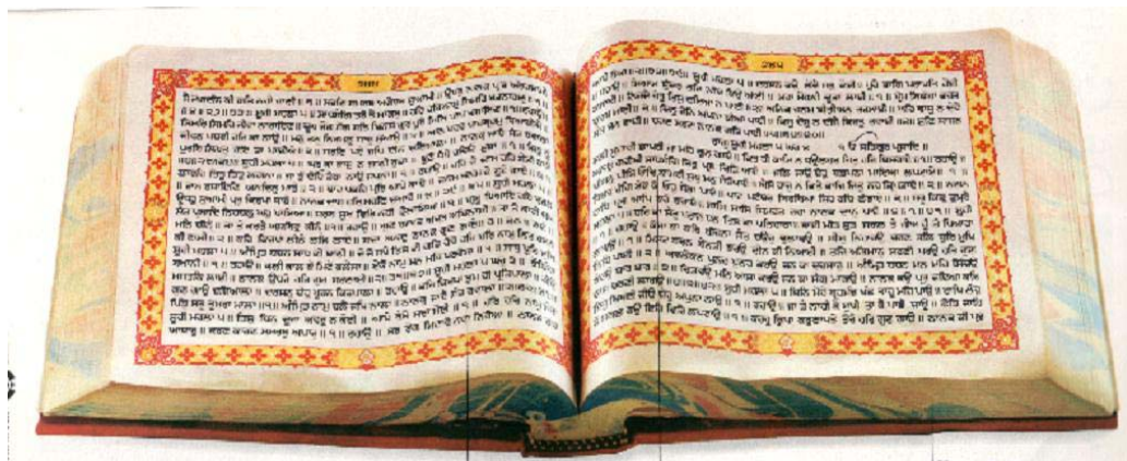
De Sri Guru Granth Sahib.

Niemand kan deze regels veranderen of er een nieuwe betekenis aan geven. Elke regel die de leerstelling van het geloof verandert is verboden.